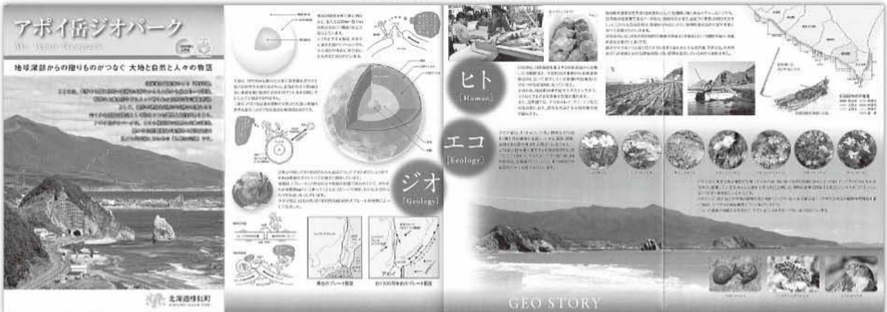
様似町役場発行パンフレットのの一部