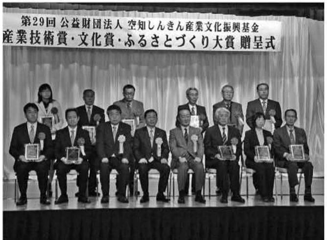
産業技術賞・文化賞受賞のみなさんと