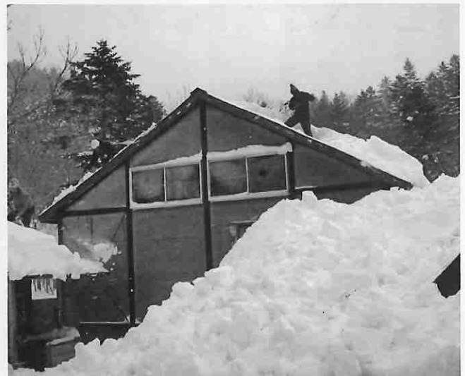
現ヒュツテとトイレ棟雪下ろし作業