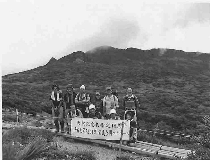
同会は北海道の高山植物保護活動の草分け

さんとそれぞれの活動について意見交換をして無事に日本山岳遺産サミットを終了しました。記念品に夕張岳の模型と山岳遺産基金の目録を受け会場を後にしました。 すでに会では二十五周年記念誌作成に向けて、編集会議を二回開いています。原稿依頼から写真集めなど、これから皆さんにお願いしなければならぬかと思えます。 よろしくお願いたします。