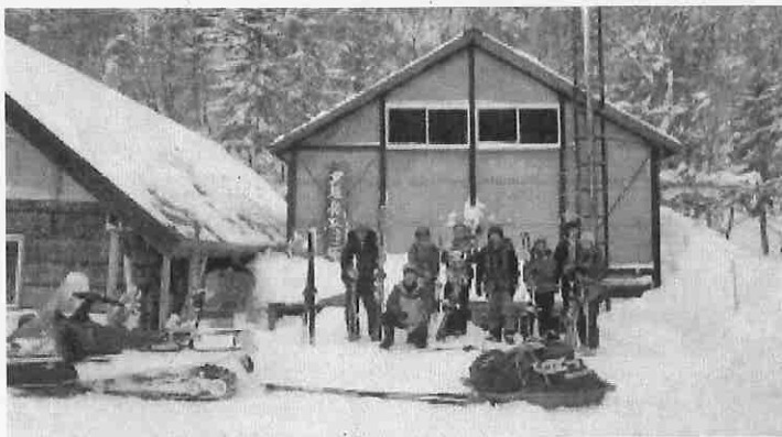
任務を果たして帰路へ発つ 1月27日

盛りだくさんな年になります。二十五周年誌・ 祝賀会・NPO法人化の検討・バイオトイレ の設置等々。気が遠くなりそうです。そこそ この人は無理のないように、比較的若い人は 少しだけ無理をして、次年度も頑張りまし ょう。