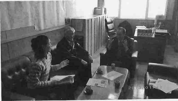
空知森林管理署 桃木署長（右側）

また、ヒュッテ建替で多大なご協力をいただいた道森林管理局へ祝賀会のご案内と、日本森林業振興会へ助成要望も合わせてお願いしました。