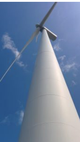
風車を真下からみるとかなりの迫力があります

その後、夕食、懇親会と流れ、翌朝からは石狩市に建設が予定されている風車の建設状況(立地状況)や周りの自然環境の確認を行いました。