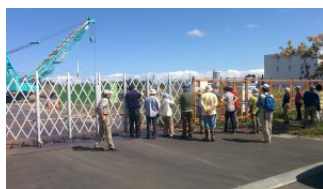
風車の建設現場の確認