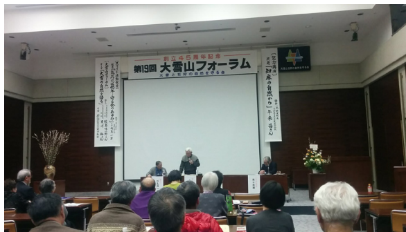
大雪山フォーラムの様子

とてもまねのできることはありません。私たちの会も少しでも守る会に近づきたいと思えます。自然を慈しみ多くのことを自然から学び、はぐくむ子供たちを育てる、終わりのなき活動を続けていきましよう。