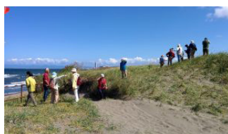
石狩海岸にて植物の確認を行う。ここまで来る途中のカシワ・ミズナラの天然林は見事でした。