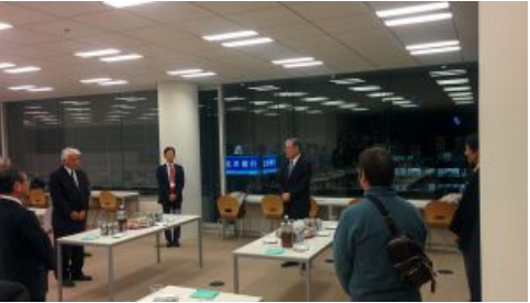
社員食堂での懇親会