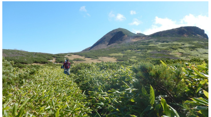
釣鐘岩の下部でささ刈りをするボランティアメンバー。空知振興局から応援メンバーも加わり作業を行った。笹刈りは毎年少しずつでも行う必要があります。

今回はエンジン草刈り機1台のみでの作業の為ともと広範囲の作業はできません。時間が無くなつてきたので、蛇紋岩崩壊地から分岐までと馬の背コースは刈りませんでした。この区間はさほど被っていないので、問題ないと思われまふ。