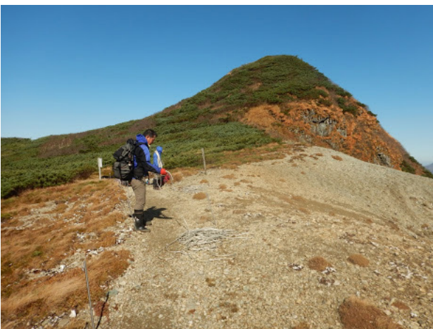
吹き通しのロープ撤収作業。ロープは来春まで現地にデポしておきます。この日は大夕張コースは通行止めで登山者はゼロだったが、金山コースからは数人の登山者がいた。

笹刈り作業は毎年少しずつでも継続しないとすぐに笹が蔓延り、大敵のマダニの温床にもなりますので、来期も計画に入りたいと思います。帰りは馬の背コースを通りましたが、先日台風の影響と思われる倒木が4本ありました。内3本に関しては40cm以上の太い木なので処置も大変かもしれません。来春の雪解け後にも例年数本の倒木があるので、まとめて処置する形になるかと思ひます。ヒュッテに到着したのは14時45分で15時過ぎにヒュッテを出発。下りの林道歩でしたが、作業付きの山頂までの往復13.5kmの後の9kmはととても長く感じました。