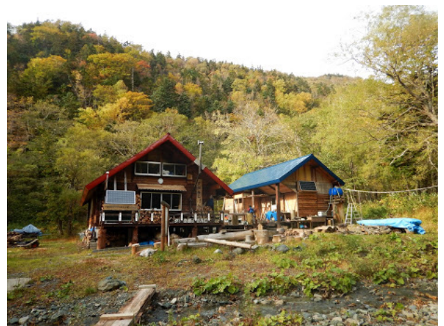
林道通行止めの影響もあり、今シーズンの宿泊は平年の1/4だったヒュッテ。炊事棟の建設作業も資材の運搬が出来ず、計画通りには進まなかった。冬囲いを始める前のヒュッテの写真。