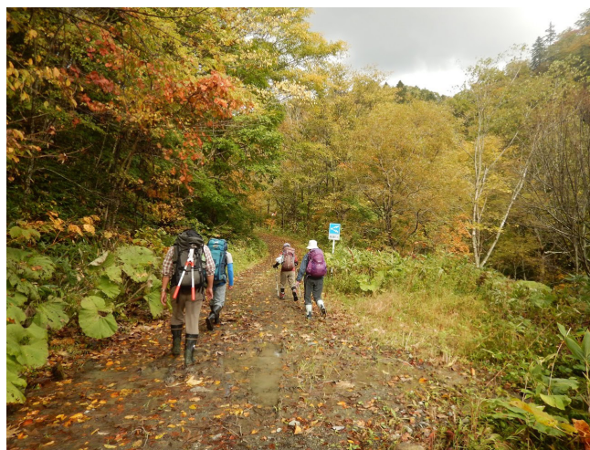
林道を徒歩で歩いてヒュッテに向かう。鹿島林道が通行止めになった為、ゲートからヒュッテまでの約9.4 kmは徒歩による移動が余儀なくされた。それでも日帰りで夕張岳を往復する健脚な登山者も見受けられた。

私たちの会は三十年、その十五年前に発足し、四十五年もの長きにわたって続けられたことは、真に凄いことだと思います。永いだけでなく活動内容が多岐にわたって成果を上げ、また長期の計を立てて次世代を担う育成教育に力を注ぎ実行していることは、