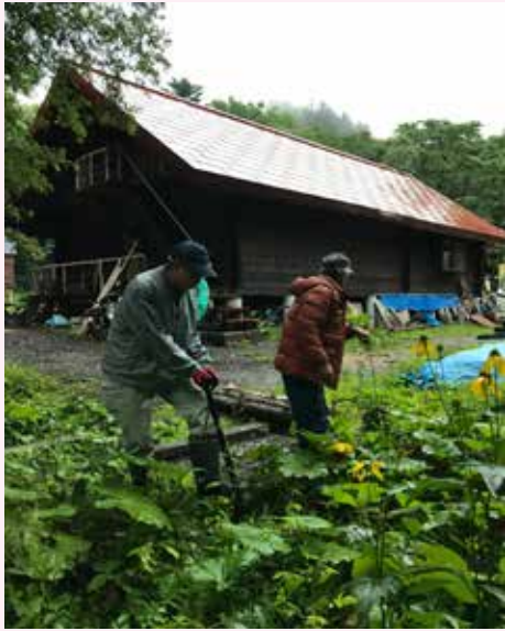
ヒュッテ裏でオオハンゴウソウの除去を行う

気が付いたらオオハンゴンソウが、ヒュッテ北西角の薪原木を置いてある所に、五、六株黄色い花を咲かせていた。以前から駐車場ゲートから上には絶対に外来種は侵入させてはならないと思っていたが、ついにやられてしまった。オオハンゴンソウ学名 Rudbeckia laciniata はキク科の多年草で環境省指定特定外来生物です。北米原産で日本へは明治中頃観賞用として導入された。種子や地下茎で繁殖するため、根絶には困難を極める植物である。