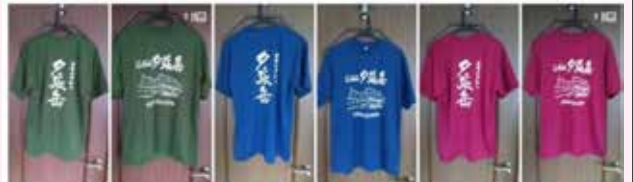
左からオリーブ（緑）、インディゴ（青）、パーガンディ（ピンク）写真見本はLLサイズ

（コザクラ会員本人様着用は¥1,000になります。） 送料は2枚まで¥370、4枚まで¥520となります。