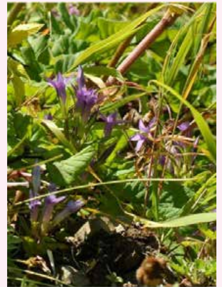
図5：エリアB ユウパリリンドウ