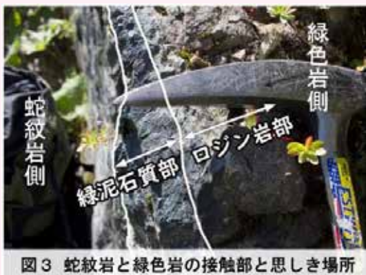
図3 蛇紋岩と緑色岩の接触部と思しき場所

図2のエリアAの面を図3に示します。ここには蛇紋岩側に暗青緑色の緑泥石と思われる鉱物の層があります。緑色岩側は白くなっています。この部分が蛇紋岩からカルシウムを注入された部分「ロジン岩」ではないかと思われます。蛇紋岩とロジン岩の境界には緑泥石ができるのが普通です。釣鐘岩と接していた蛇紋岩は風衝地の蛇紋岩(アンチゴライト岩という高温で出来る蛇紋岩)と思われる。夕張岳のアンチゴライト岩は非常に多くのカルシウムを吐き出します。露頭が真っ白になるくらいです。しかし、この蛇紋岩の元となったかんらん岩は斜方輝石かんらん岩であり、カルシウム成分は少ないのです。カルシウムはどこから来たのか、一つに、蛇紋岩の外からもたらされた可能性があります。夕張岳のアンチゴライト岩があるところは石灰岩があるところと似たような環境になるかもしれな