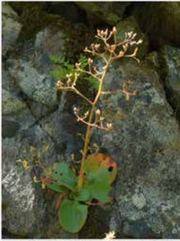
図4：エリアA ヤマハナソウ

Aは、緑色岩が変化してできた部分と思われる、蛇紋岩ではありません。Bは、破碎部であるため、接触していた蛇紋岩が混在している可能性があります。Cは、緑色岩そのものであるため、蛇紋岩の影響はないと思われれます。