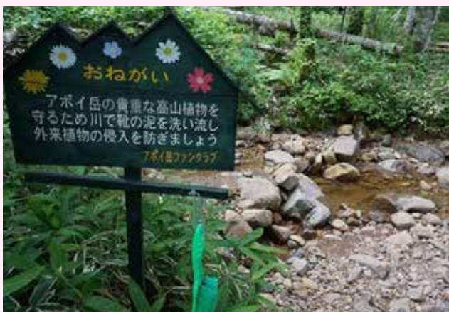
アポイ岳の登山口近くにある沢の靴洗い場

アポイ岳の交流会の時見たのですが、川で登山者の靴を洗ってもらうように、洗車ブラシを置いてありま