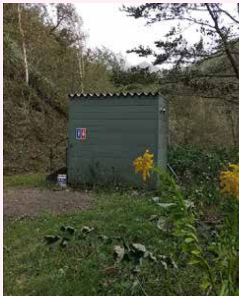
近辺のセイタカアワダチソウ

一方セイタカアワダチソウであるが、駐車場のバイオートイレのところにも数株生えていた。学名 Solidago canadensis var. scabra で、これも北米原産のキク科の多年草で種子と地下茎で繁殖する植物である。十朱幸代の戸わたしにや沖縄遠すぎる戸なんてセイタカアワダチソウの歌がありました。